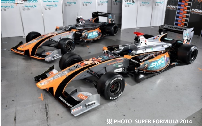
※ PHOTO SUPER FORMULA 2014