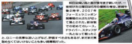
(33号車) ロニー・クインタレリ 5位 (34号車) 横溝 直輝 10位