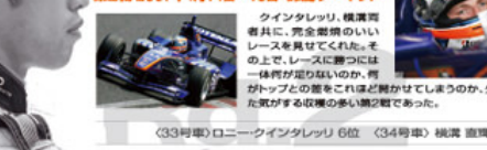
(33号車) ロニー・クインタレリ 6位 (34号車) 横溝 直輝 9位